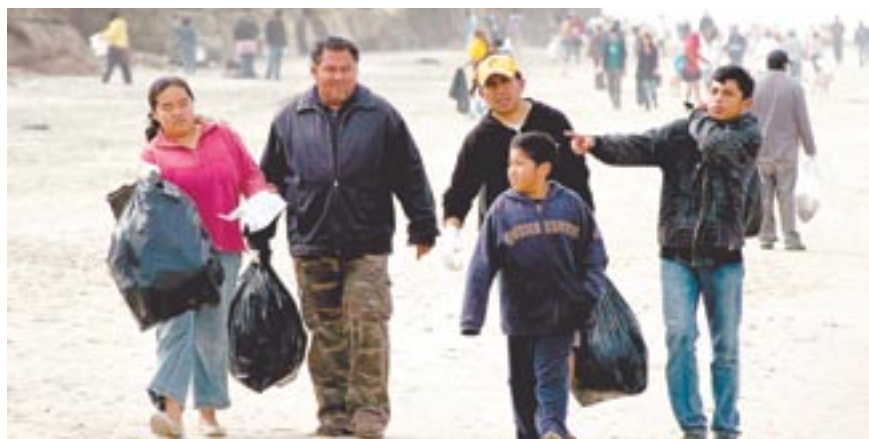
Hubo familias enteras que se sumaron al esfuerzo.