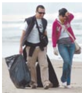
Utilizaro bolsas negras.

Clubes de artistas como Numen 13, estudiantes de la Ibero, UABC, de la secundaria número 1 "La Poli", de empresas médi-