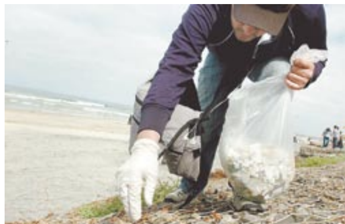
Se notó la presencia de jóvenes.