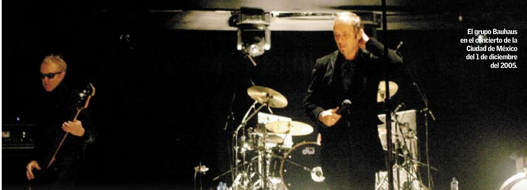
El grupo Bauhaus en el concierto de la Ciudad de México del 1 de diciembre del 2005.