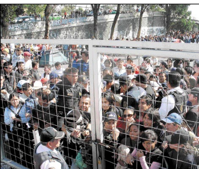
Así lució la fila para comprar boletos del concierto de U2 en el estadio Azteca.